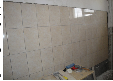
297 sayılı orta məktəb təmir zamanı

Əvvəlcədən planlaşdırıldığı kimi, təmir işlərinə iki məktəbdə - Binəqədi rayonunda yerləşən 297 və 300 sayılı orta məktəblərdə başlanmışdır. Hal-hazırda bu məktəblərdə təmir işləri davam etdirilir - şagirdlərin təhlükəsizliyini təmin etmək üçün tədbirlər görülmüş, təlimçi tərəfindən maarifləndirmə işləri aparılmışdır.