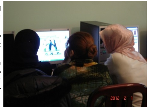
Ofisdə internet xidmətindən istifadə

Birinci rübün sonuna qədər, 5 nəfər gənc kompüter kurslarını bitirərək sertifikatlarla təltif edilmişdir.