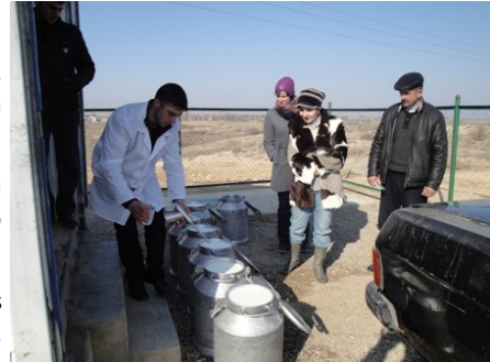
ABŞ BİA-nın nümayəndələri STM-nə səfər edərkən

Kredit xidmətləri göstərən "Parabank"-in nümayəndələrinin beş hədəf icmada (Nemətəbad, Veyisli, Seyidlər, Mollacəlilli, Sarıtəpə) fermerlərlə görüşü keçirilmişdir. Görüşlərdə sahibkarlara Kömək Milli Fondunun vəsaiti hesabına illik 6-7%-lə verilən Aqrokreditlər (heyvandarlıq, əkinçilik, bağçılıq, quşçuluq) haqda məlumat verilmişdir. Həmçinin, Samux rayon Seyidlər icmasında süd istehsalçılarında "Aqromexanika" Elmi Tədqiqat İnstitutunun baş mütəxəssisi tərəfindən yem üyüdən və ot xırdalayan qurğular nümayiş etdirilmişdir.