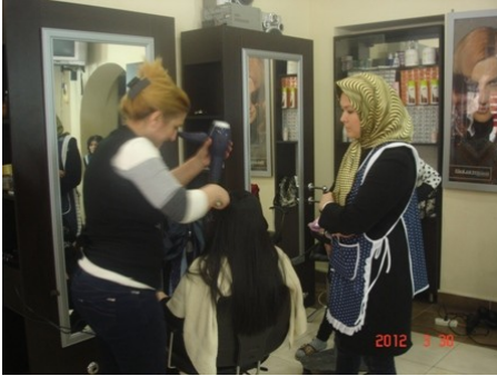
Qadın-bərbəri sahəsində təlim

Bu il ərzində, layihə üzrə 25 nəfərin Usta Yanında Şagird Hazırlanması (UYŞH) kurslarına cəlb edilməsi nəzərdə tutulmuşdur.