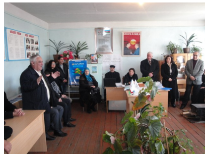
Quba rayonunun Zərdabi icmasında layihə barədə məlumatın verilməsi məqsədilə görüş

Aran və Şimal regionları üzrə “yeni” hədəf icmaların seçimi icmalarda əməkdaşlığa dəvət məktublarının paylanması və bu məktublara uyğun olaraq icmalar tərəfindən maraq məktublarının təqdim olunması ilə həyata keçirilmişdir. Maraq məktubları təqdim etmiş icmalar haqqında məlumatlar Seçim Komissiyası tərəfindən qiymətləndirilmiş və SEDA layihəsində əməkdaşlıq üçün “yeni” icmalar seçilmişdir ki, bunlar: Sabirabad rayonunun Qaralar, Zəngənə və Qaraqaşlı icmaları, Şabran rayonunun Taxtalar, Əmirxanlı və Pırəmsən, Quba rayonunun İspik, Qonaqkənd, Alpan və Qəçrəş icmaları və İmişli rayonunun Çahar, Ağammədli, Əliyətməzli və Nurulu, Xaçmaz rayonunun Çarkı, Arzu və Ağçay, Beylaqan rayonunun Aşağı Cəmənli, Aşıqalılar və İmamverdili icmalarıdır.