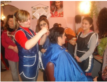
Qadın-bərbəri sahəsində təlim

Sumqayıt şəhərində, eyni zamanda şəhərətrafı ərazilərdə - Tağıyev və Ceyranbatan qəsəbələrində, Sarıqaya və Yaşıldərə massivlərində müvəqqəti məskunlaşmış 23 məcburi köçkün icmalarında layihə barədə görüşlər keçirilmişdir. Cəmi 220 nəfərin iştirak etdiyi bu görüşlərdə icma üzvlərinə layihə barədə ətraflı məlumat verilmiş, layihənin mahiyyəti və məqsədi barədə izahatlar verilmiş, eyni zamanda insanların müxtəlif tipli sənətlərə olan ehtiyacları müəyyənləşdirilmiş və məcburi köçkün gənclərin həmin sənətlərə maraqlarını nəzərə alaraq həmin ərazilərdə elanlar vurulmuşdur.