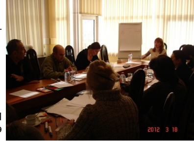
QQGM-də yay düşərgəsinin təşkili ilə bağlı keçirilən görüş

seçilən təlimçilərə, Rusiyadan dəvət olunmuş peşəkar psixoloq tərəfindən “Uyğunlaşmamış uşaq və yeniyetmələrin psixososioloji reabilitasiyası” mövzuda 3 günlük təlim verilmişdir. Təlim zamanı psixososioloji reabilitasiyanın üsulları və metodikaları barədə məlumat verilmiş və praktiki məşğələlər keçirilmişdir. Sonda düşərgə proqramının ilkin variantı hazırlanmışdır. Proqramı hazırlayarkən ötən ildəki düşərgənin təcrübəsi, təlimdə təklif olunan yeni metodikalar nəzərə alınmışdır.