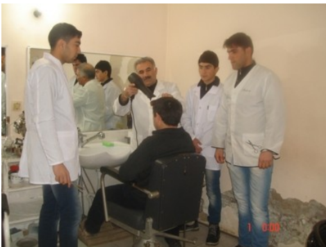
Kişi-bərbəri sahəsində təlim

2012-ci ilin yanvar-mart ayları ərzində, 8 nəfər məcburi köçkün gənc MS Office və Adobe Photoshop proqramları üzrə təlimlərə cəlb olunmuş, onlardan 4 nəfəri MS Office proqramları üzrə təlimləri başa vuraraq sertifikatlar almışlar. Kompüter təlimləri həftədə 2 dəfə və 1,5 saat olmaqla “Ümid” SİD İB-nin Sumqayıt ofisində həyata keçirilir. Ötən illərdə, şagirdlərə MS Windows, Word, Excel, Power Point, Paint proqramları və İnternet Explorer proqramında işləmək yolları öyrədilirdisə, artıq onların istəyi ilə təlim proqramı bir daha təkmilləşdirilmiş və əlavə olaraq,