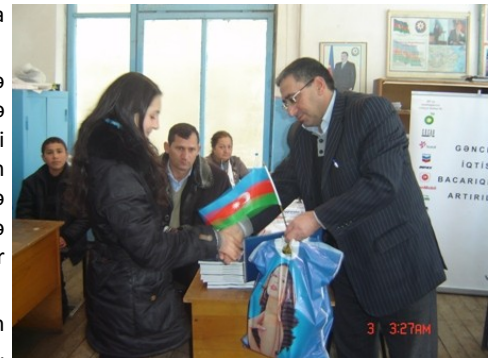
Tovuz rayonu Aşağı Mülkülü icmasında Bilik yarışması qaliblərinin mükafatlandırılması